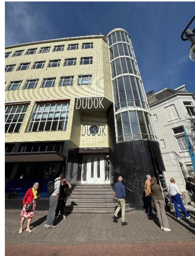
Wim Lavooij geeft uitleg